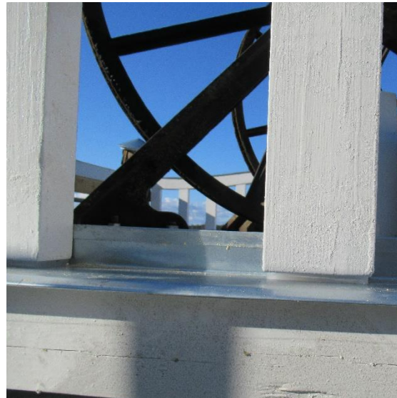
Spjälorna har en akrylskiva mellan ändträ och plåt för att förhindra fuktupptagning.