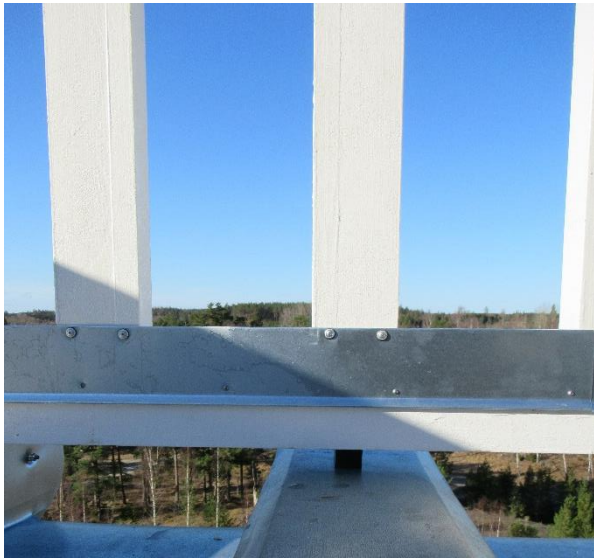
Underliggarna stöds av mellanlägg av polyeten dels för att förhindra fuktupptagning kapillärt, dels för distans för de stående falsarna på panelbalustraden