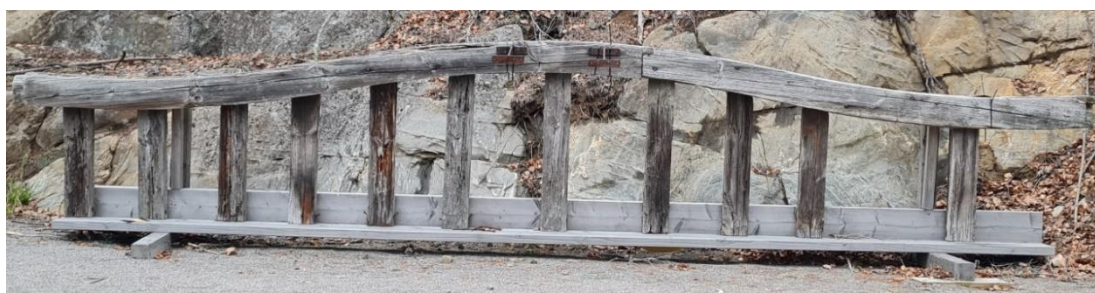
Främre balustraden ihopmonterad 2019.