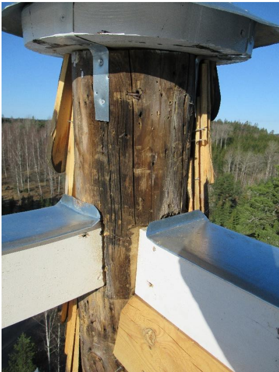
Överliggarna tappade in i stolparna, som tidigare. Underliggare skråskruvade i stolparna. Spånen återmonteras runt stolparna. Plåttäckningen falsad och monterad med klammer på traditionellt vis